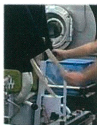
写真1 新スリーバー 写真2 バネを持つ 写真3 木を持つ