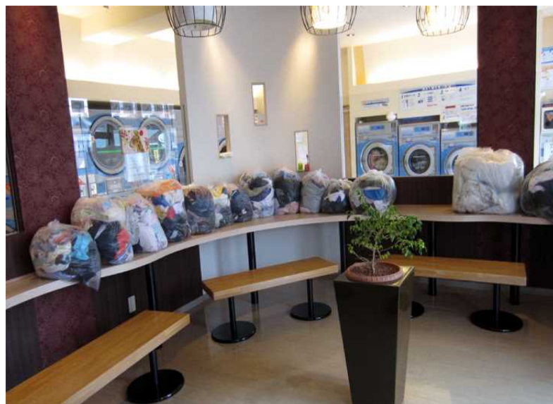
写真沖－ 14 取りだされた商品